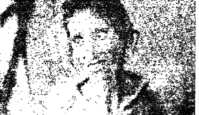
تضرع الى السماء